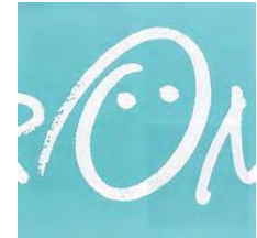
Essen und Trinken