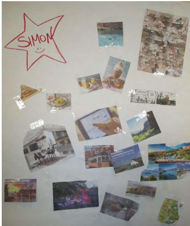
Wünsche und Träume